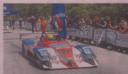
OSELLA PA 2000 Domenico Scola Due terzi posti per Domenico Scola sull'Oseella PA 2000