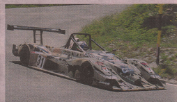
OSELLA PA 21 EVO Rosario Iaquina Iaquina a segno con l'Oseella PA 21 EVO e leader in CN